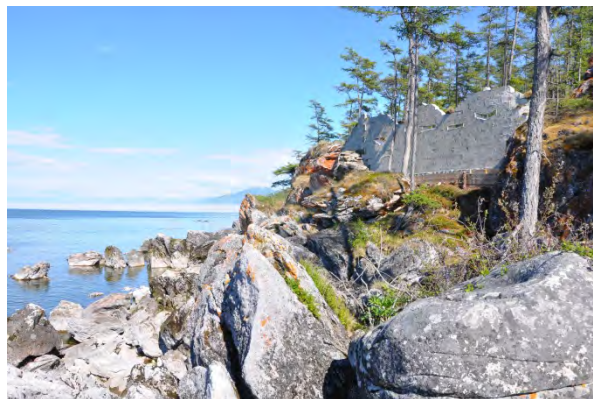
Рис. 5 и 6. Защитная стенка из газобетона, вид со стороны озера, на первом снимке практически не видна.