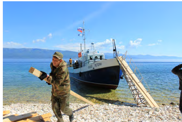
Рис. 2 и 3. Транспортировка, разгрузка т/х Ш.Петефи на о. Тонкий.