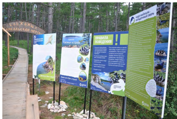
Рис. 10 и 11. Декоративная входная арка и информационные аншлаги на экотропе.