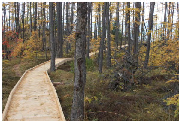
Рис. 3 и 4. Готовый деревянный настил и настил-пандус с перилами на экотропе.