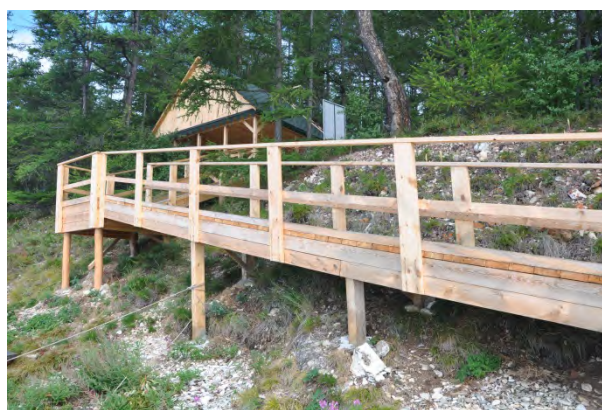
Рис. 8 и 9. Строительство беседки и беседка и настилом-пандусом.