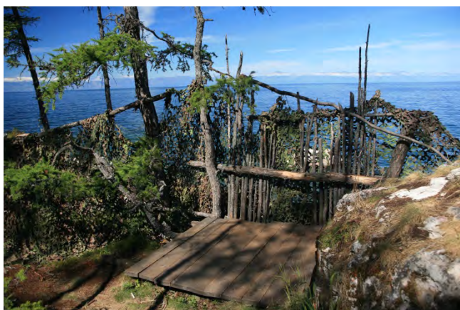
Рис. 1. Смотровая площадка и защитная стенка на этапе рекогносцировки до начала строительных работ.

Включала измерение протяженности тропы, геоморфологических условий местности, условий зарастания, объемов земляных и плотницких работ. Работы проведены силами специалистов ФГБУ «Заповедное Подлеморье» при участии специалистов Службы Леса США и Тахо-Байкал Института.