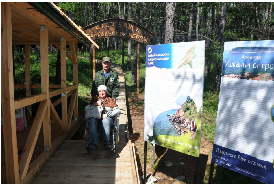
Рис. 12, 13 и 14. Дополнительное оборудование – лавочка, мусоросборник, инвалидная коляска.