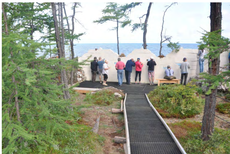
Рис. 7 и 8. Резиновое покрытие уложено на полотно тропы и смотровую площадку.