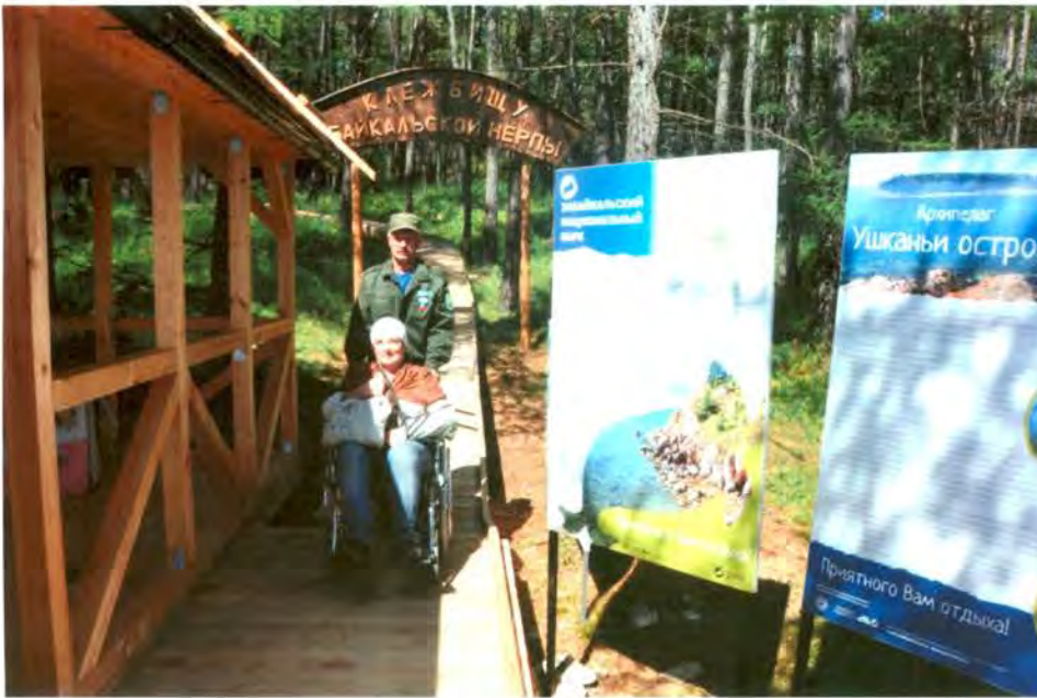
Рис. 12, 13 и 14. Дополнительное оборудование – лавочка, мусоросборник, инвалидная коляска.