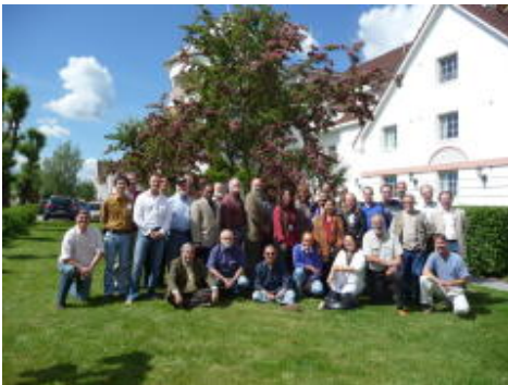
Participants Dahlem-Type workshop

This is the conclusions of 40 international experts from wide ranging disciplines including economics, social sciences and natural sciences who met for an intensive, 5 day workshop near Oslo, Norway. They came from 6 continents to review the development of coastal zones and society worldwide. Read more: