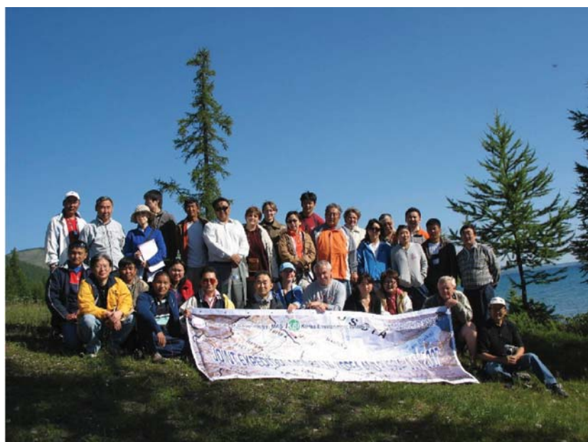
Рис. 4. Участники совместной российско-корейско-монгольской экспедиции «Оз. Хубсугул — оз. Байкал», июль 2007 г.