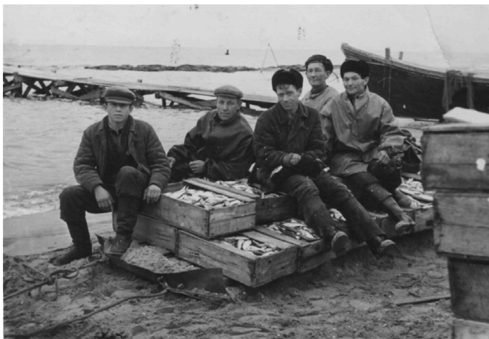
На фото: Рыбаки Каспия с уловом сельди. 1961 г.