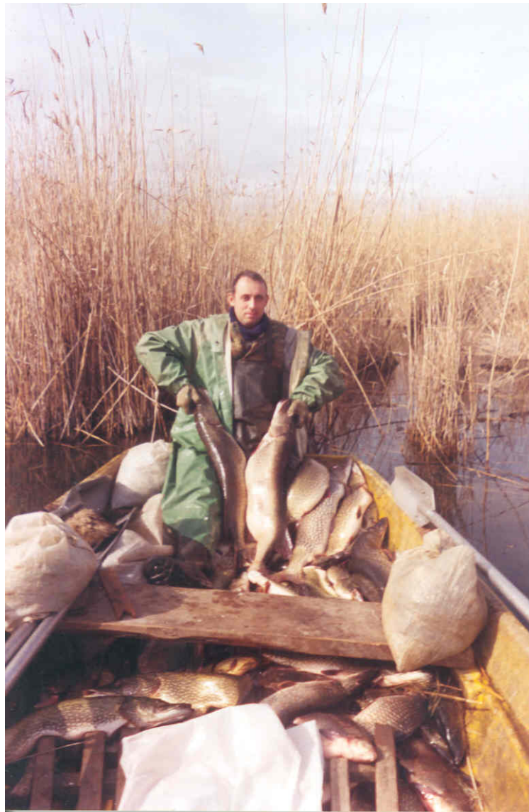
А.В. Лоскутов. Аграхан. Улов икрающей щуки. Февраль, 2006 г.

(Зап. от А.В. Лоскутова, г. Махачкала, 2006 г. ).